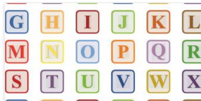
Informatie en contact